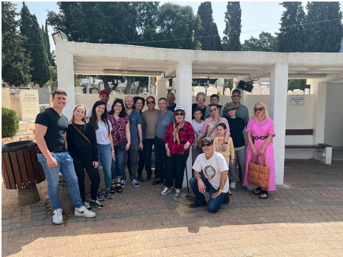
המשפחה המצומצמת – כמעט במלואה.